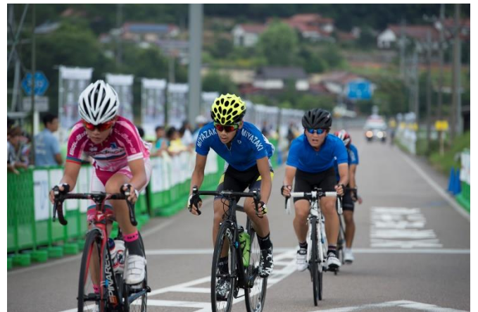
スタート・フィニッシュ地点